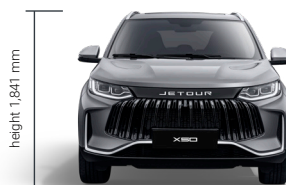
height 1,641 mm